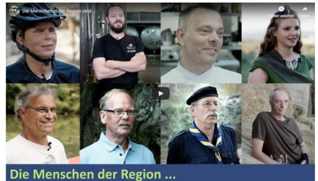
Die Menschen der Region ...

Was macht die Hunsrück-Nahe-Region für die Menschen so besonders? Mit dieser und weiteren Fragen befasst sich das Projekt „Markante Typen“ des Regionalbündnisses Soonwald-Nahe. In kurzen Videoclips werden Menschen aus verschiedenen Branchen und Orten, mit abwechslungsreichen Charakteren und unterschiedlichsten Dialekten aus der Hunsrück-Nahe-Region vorgestellt.