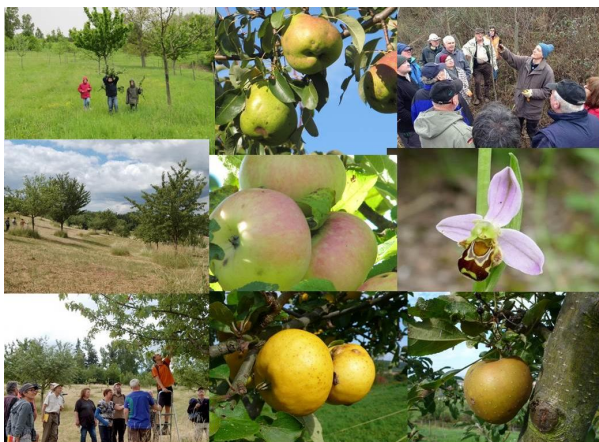
Im Guldentaler Streuobstland kann sich zukünftig jeder rund um das Thema Streuobst informieren.

Projektträger: Ortsgemeinde Guldental | Fördersatz: 75 % | LEADER-Förderung: ca. 37.000 €