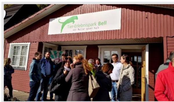
Bild1: Tier-Erlebnispark Bell

Verwaltungsbehörde, der ADD und den LEADER-Managern der rheinland-pfälzischen LEADER-Regionen. Anschließend wurden die LEADER-Vorhaben „Tier-Erlebnispark Bell“ bzw. die „Geierlay-Hängeseilbrücke“ besichtigt.